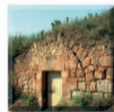
8: Mas de Volta