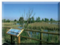
6: Mirador dels Jòquers