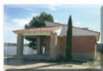
7: Refugi de pescadors