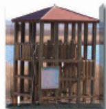
5: Observatori elevat "el 19"