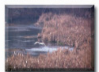
2: Agró blanc al riu Segre