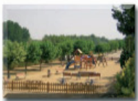
3: Parc Infantil