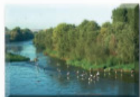
1: Panoràmica del riu