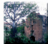
10: Restes molí