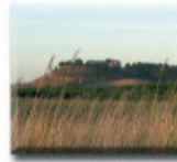
12: Ermita i Tossal de Carrasumada